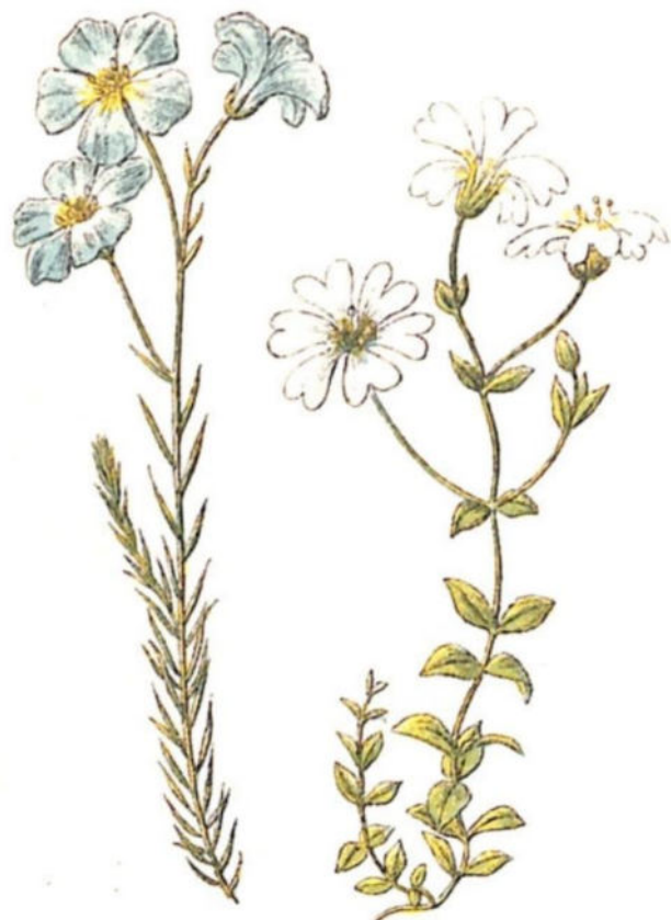
Lino alpino ( Linum alpinum L.)