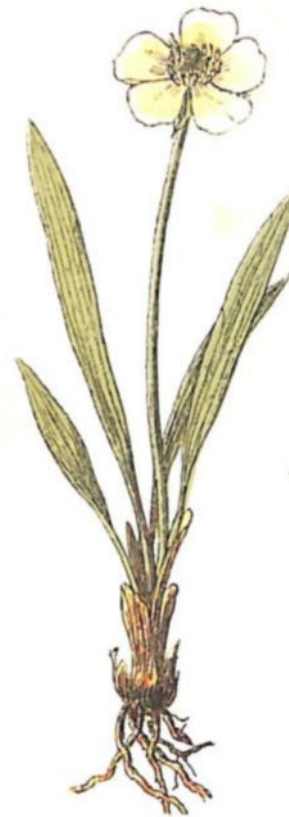
Ranuncolo dei Pirenei ( Ranunculus pyrenaeus L.)