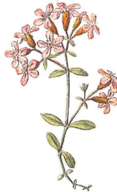
Ocimoide rossa ( Saponaria ocymoides L.)