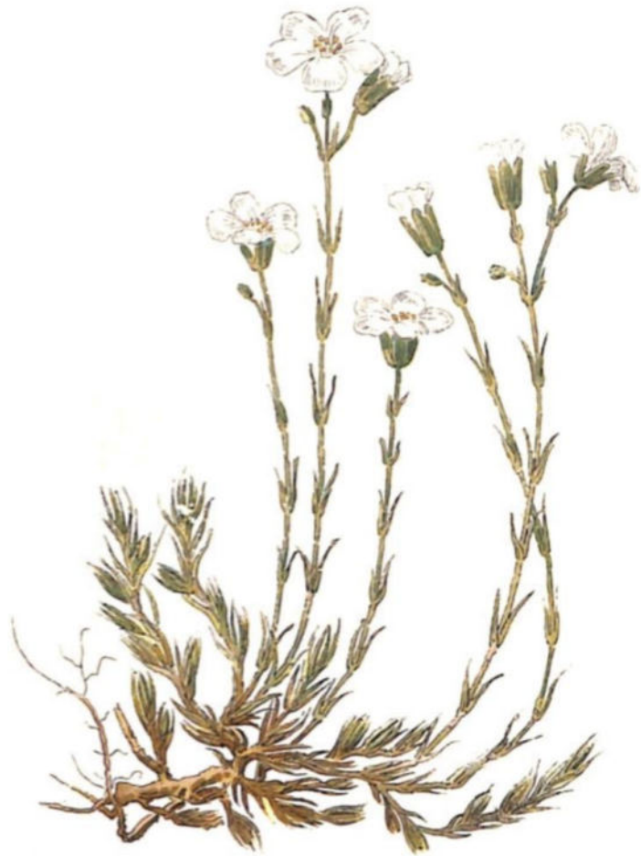
Renaiola pelosa ( Alsine laricifolia Crantz.)