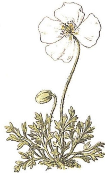
Papavero alpino ( Papaver alpinum L.)