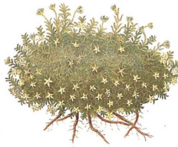
Renaiola borracina ( Cherleria sedoides L.)