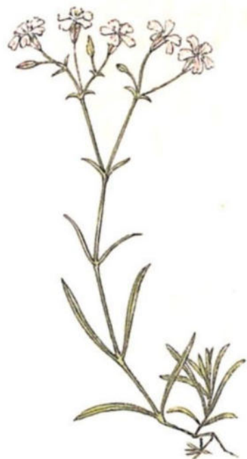
Garofanina sdrajata ( Gypsophila repens L.)