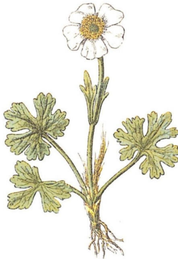
Ranuncolo alpestre ( Ranunculus alpester L.)