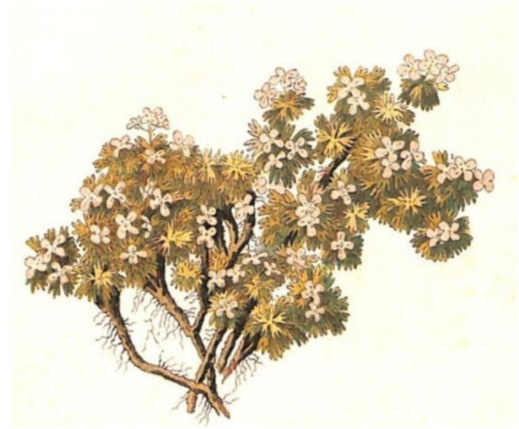
Grazia delle rupi ( Petrocallis pyrenaica R. Br.)