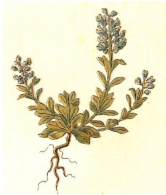
Poligala d'Alpe ( Polygala alpina Perr. et Song.)