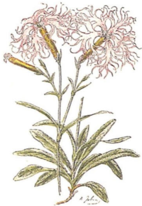
Garofano superbo ( Dianthus superbus L.)