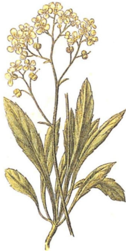
Biscutella montanina ( Biscutella laevigata L.)