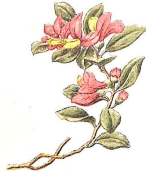
Bosso sdriato ( Poligala Chamaebuxus L. var. Rhodoptera Ball.)