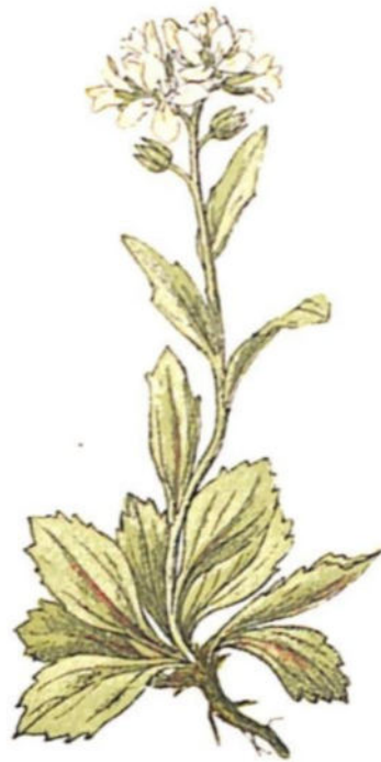
Arabetta lucida ( Arabis bellidifolia Jacq.)