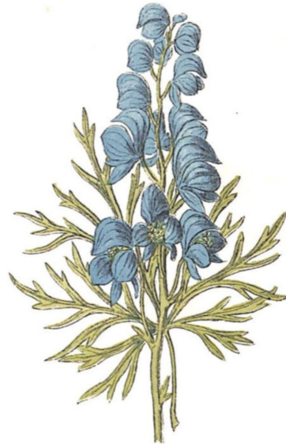
Aconitum Napellus L.)