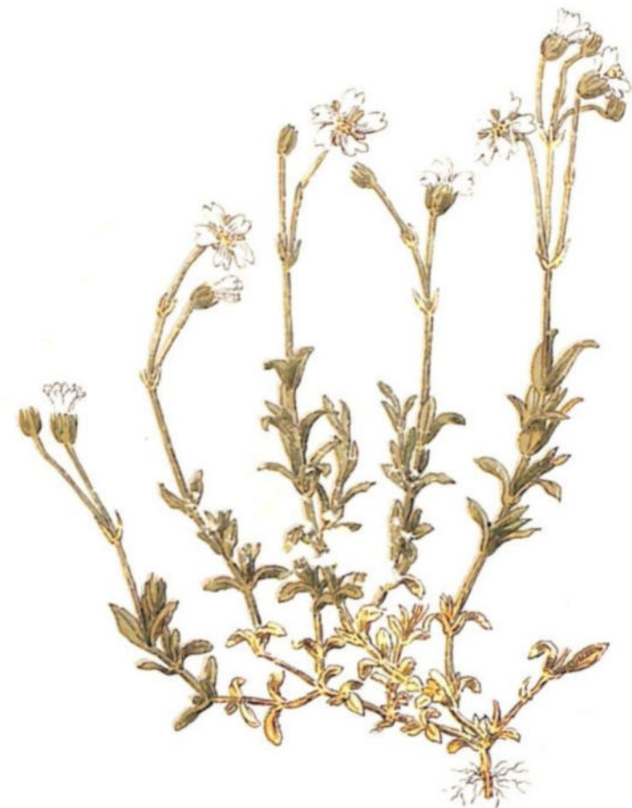
Orecchio di topo ( Cerastium arvense L.)