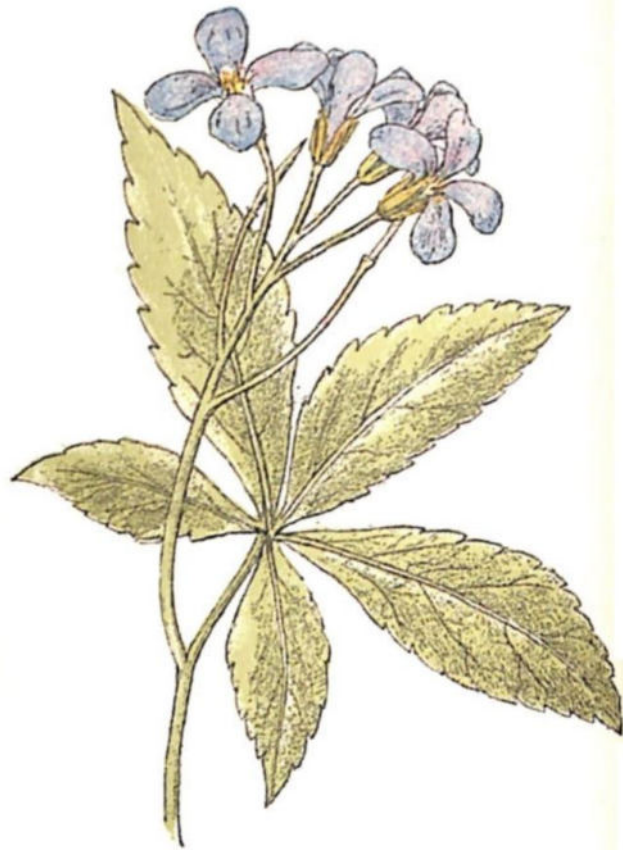
Dentaria maggiore ( Dentaria digitata Lam.)