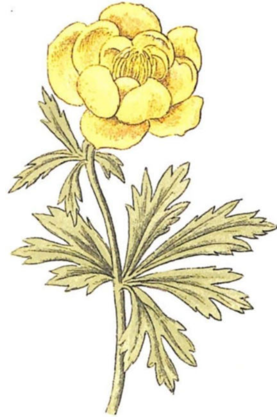
Botton d'oro ( Trollius europaeus L.)