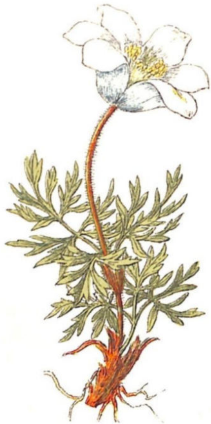
Anemone d'Alpe ( Anemone alpina L.)