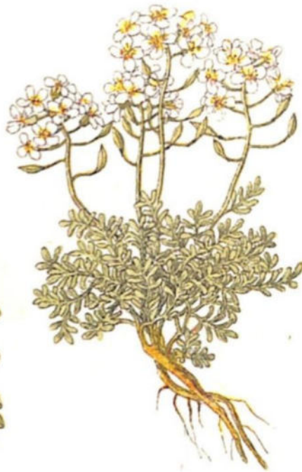
Iberidella alpina ( Hutschinsia alpina R. Br.)