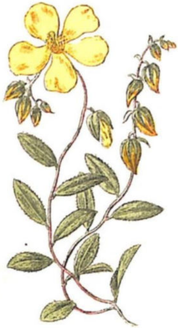
Eliantemo ( Helianthemum vulgare Gaertn.)