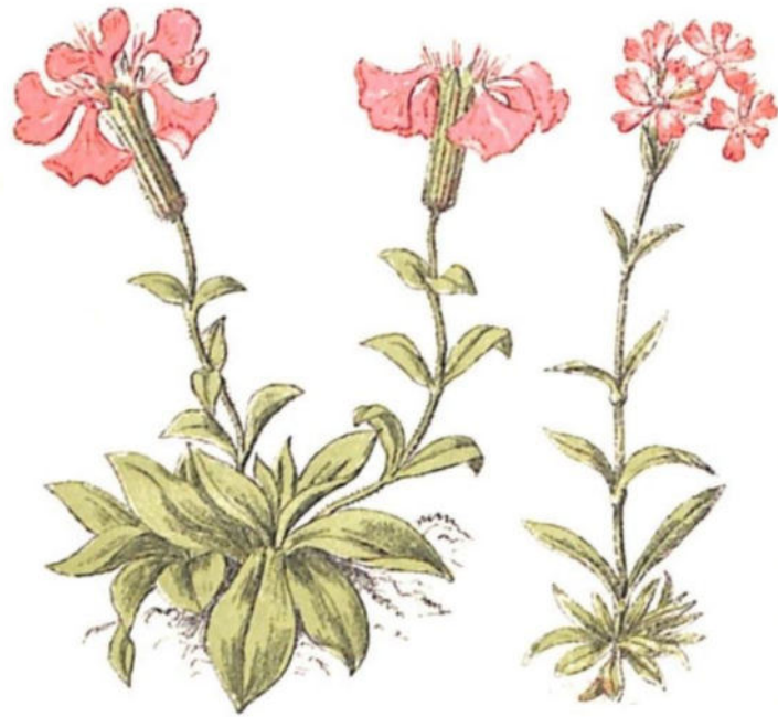
Fiore della Viceregina ( Silene Elisabethae Jan.)