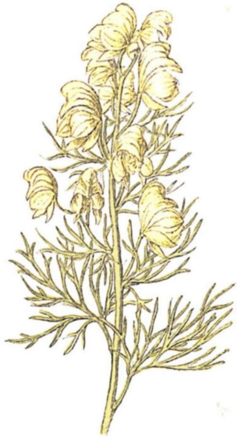
Aconito salutarium ( Aconitum Anthora L.)