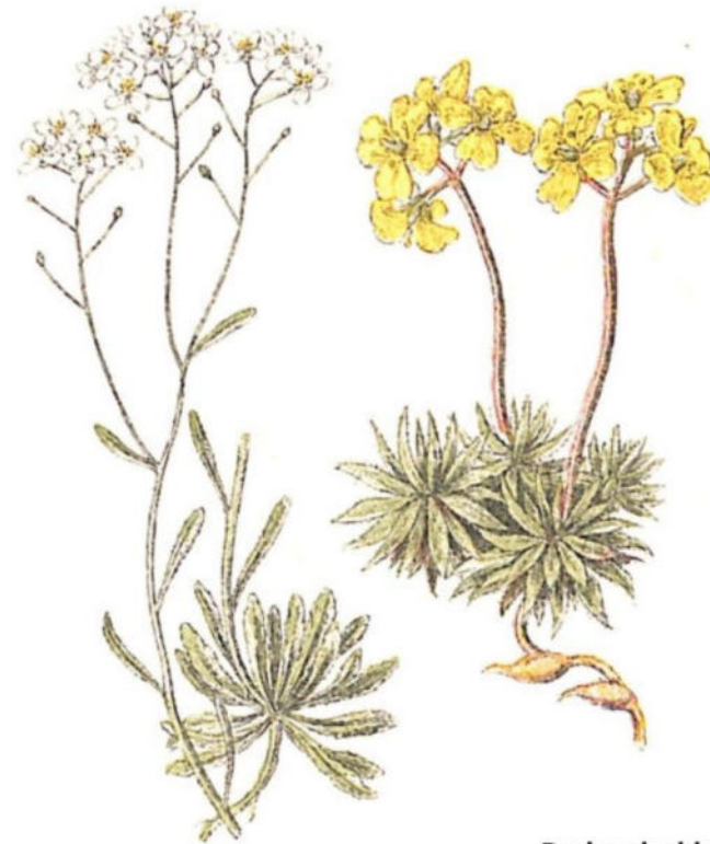
Coclearia alpina ( Coclearia saxatilis Lam.)