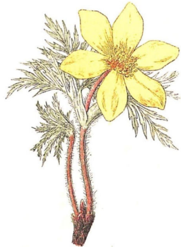
Anemone solfureo ( Anemone sulphurea L.)