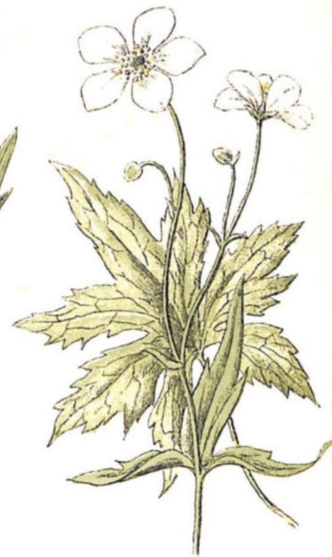
Piè di gallo ( Ranunculus aconitifolius L.)