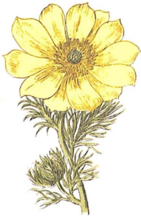
Fior d'Adone primaticcio ( Adonis vernalis L.)