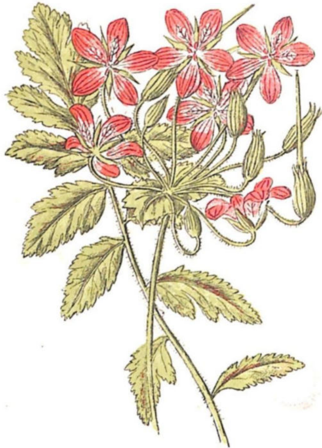
Erodio dei Pirenei ( Erodium Manescavi B.)