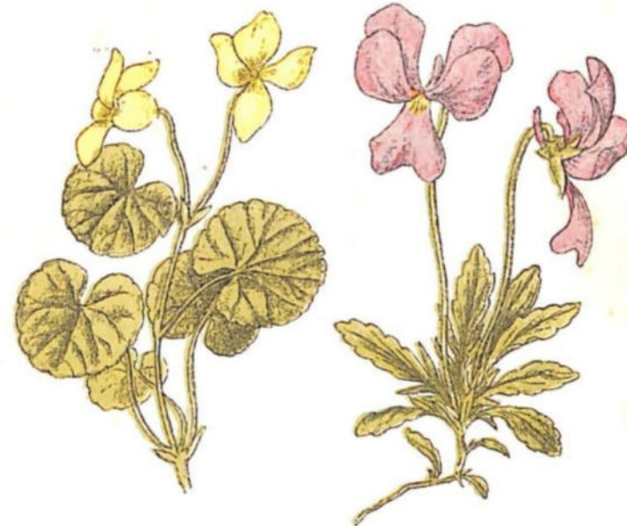
Viola gialla ( Viola biflora L.)