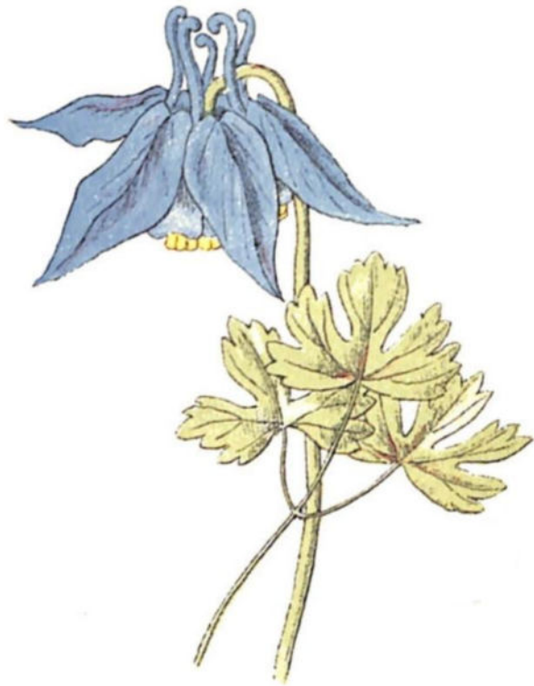
Aquilegia alpina ( Aquilegia alpina L.)