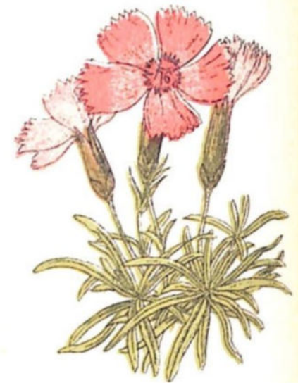
Garofano trascurato ( Dianthus neglectus Lois.)