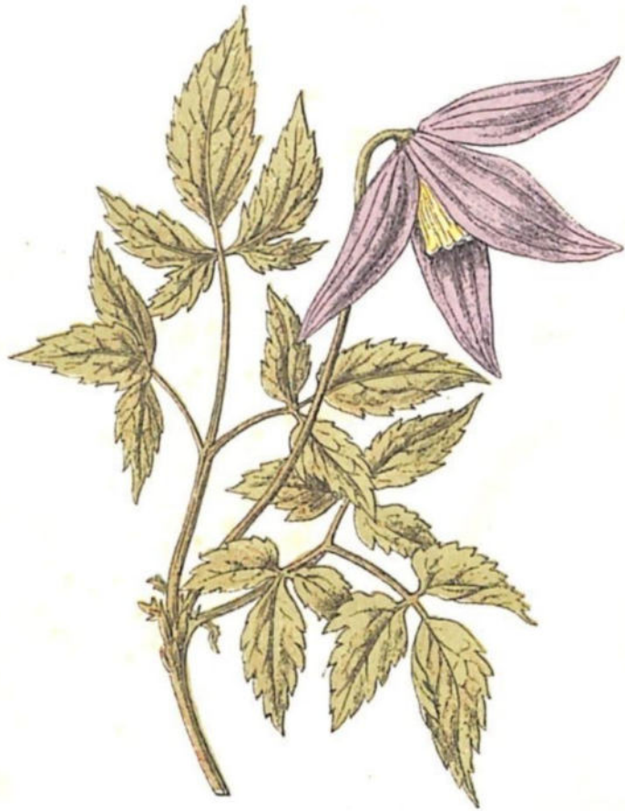
Vitalba delle Alpi ( Atragene alpina L.)