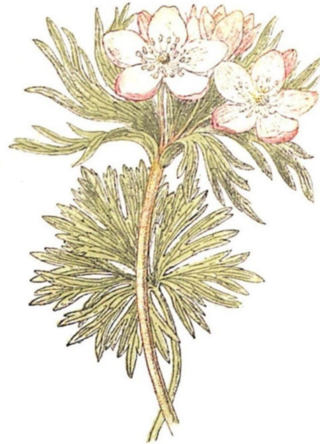
Anemone a fior di Narciso ( Anemone narcissiflora L.)