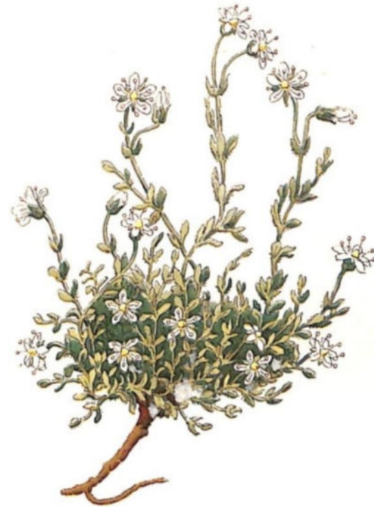
Renaiola ciliata ( Arenaria ciliata L.)