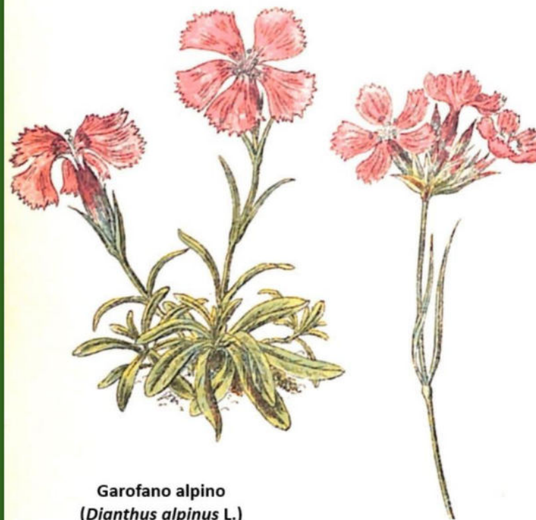
Garofano alpino ( Dianthus alpinus L.)