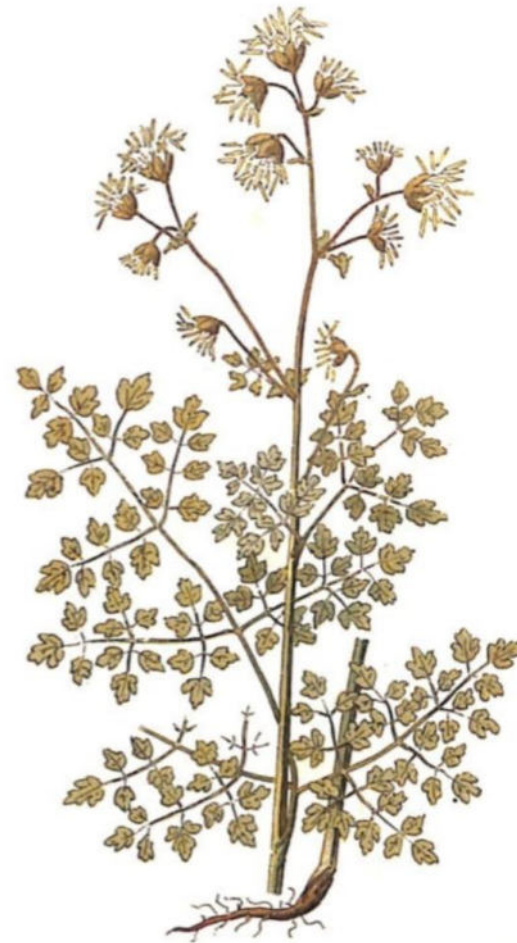
Pigamo puzzolente ( Pigamo foetidum L.)