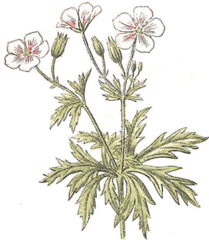
Geranio aconitifolio ( Geranium aconitifolium L'Hérit.)