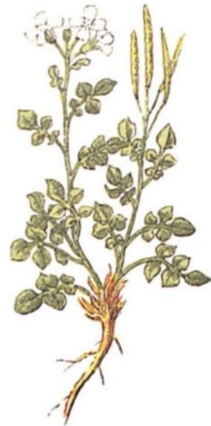
Billeri pennato ( Cardamine resedifolia L.)