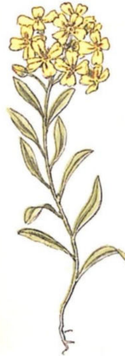
Alisso montanino ( Alyssum montanum L.)