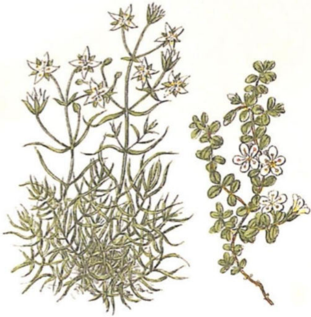
Centonchio minore (Moehringia muscosa L.)