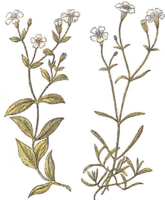
Silene rupestre ( Silene rupestris L.)