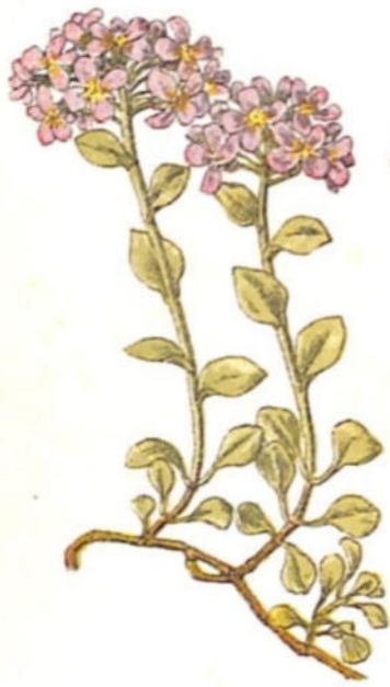
Tiaspi lilacino ( Thlaspi rotundifolium Gaud.)