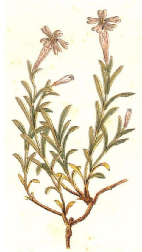
Silene del Vallese (Silene Valesia L.)