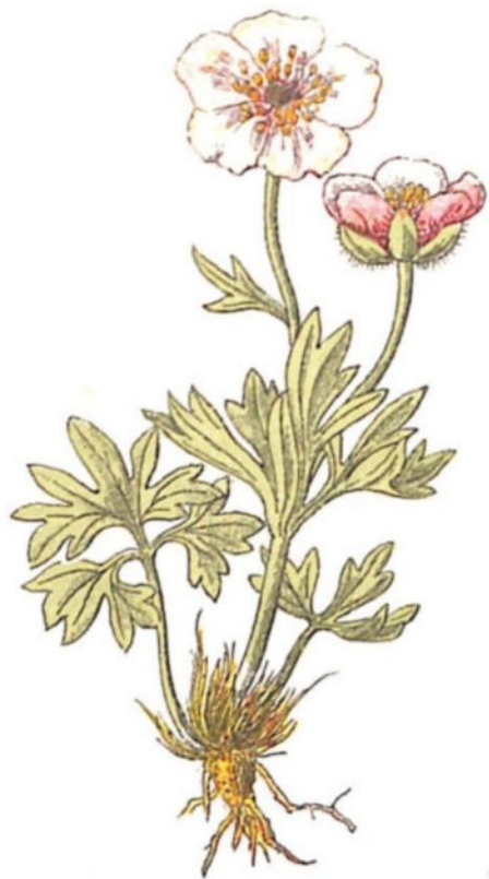
Ranuncolo dei ghiacciai ( Ranunculus glacialis L.)