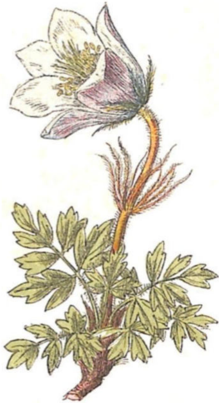
Anemone primaticcio ( Anemone vernalis L.)