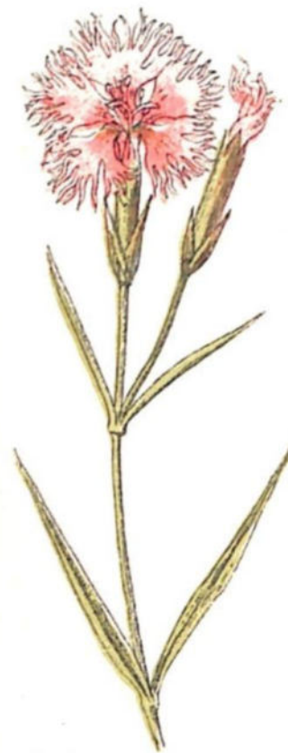
Garofano frastagliato ( Dianthus monspessulanus L.)