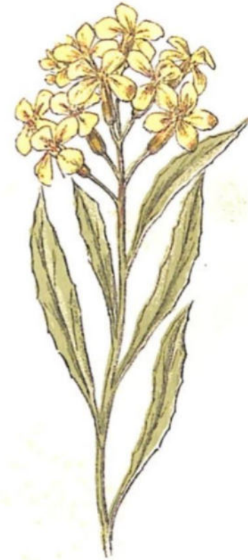
Crispinaccio d'Alpe ( Erysimum ochroleucum DC.)