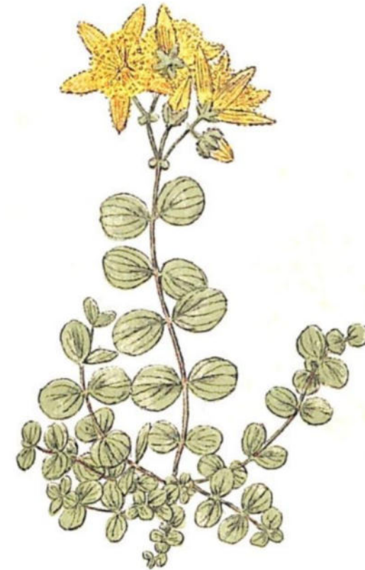
Iperico a rotella ( Hypericum nummularium L.)